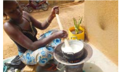
Traditionelles Kochen mit klimafreundlichem Pyrolysekocher

Öffentliche Veranstaltung / Konferenz selbst nur mit Zugangskarte