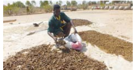
Pellets für Pyrolysekocher aus Biomasseabfallresten